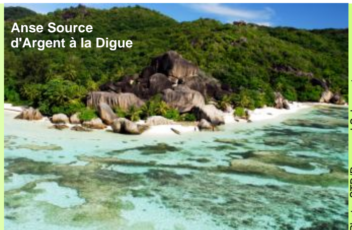
Anse Source d'Argent à la Digue

Navigation en matinée vers la Digue, une petite île où l'on se laisse bercer par le rythme lent des chars à boeufs et où les bicyclettes sont aussi le moyen de transport courant dans l'île. La Digue est le refuge du petit gobe-mouches endémique, la veuve du Paradis des Seychelles. La Digue est aussi célèbre pour ses énormes formations de blocs de granit d'Anse Source d'Argent, plage qui semble être la plus photographiée au monde. Découvrez l'ensemble de l'île en vélo, arrêtez-vous à Union Estate, vaste réseau traditionnel des activités de l'île comprenant une usine de coprah, plantation de vanille et le chantier naval.