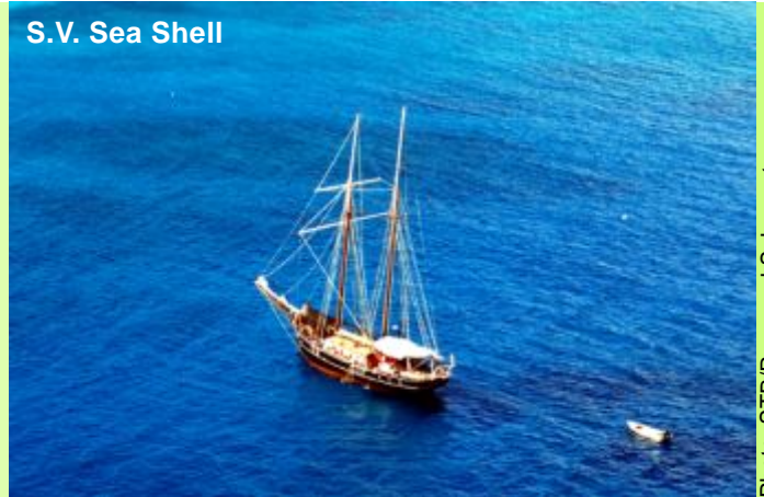
S.V. Sea Shell

Embarquement à l'Inter Island Quay à 1030hrs, Après l'accueil à bord suivi d'un commentaire du Capitaine, départ à 1200hrs vers l'île Ronde proche de Praslin. Arrivée, en fin d'après-midi pour un diner barbecue à bord.