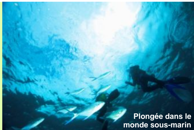
Plongée dans le monde sous-marin

Après le petit déjeuner, navigation retour vers Mahé. Nous nous arrêterons à l'île sèche pour une dernière occasion de palmes, masque et tuba ou plongée, barbecue à bord. Le bateau rentrera au Port de Victoria pour la nuit.