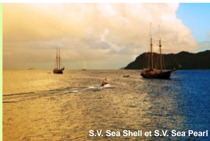
S.V. Sea Shell et S.V. Sea Pearl

Cap vers l'île Booby pour une matinée de plongée et d'activités nautiques. Après le déjeuner, navigation vers l'île Aride, l'une des plus belles réserves naturelles avec le plus d'espèces d'oiseaux marins que sur les autres îles qui s'y réfugient pour nicher. Cinq variété d'oiseaux endémiques et la plus grande population de trois espèces. Le sentier mène à une spectaculaire falaise, point de vue de la plus grande population de Frégates après l'île d'Aldabra. Aride est le seul endroit naturel de la planète où poussent les gardenias de Wright (le célèbre bois citron) et où 400 espèces de poissons ont été enregistrés autour de l'île.