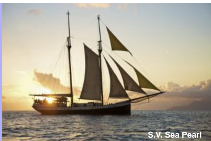
S.V. Sea Pearl