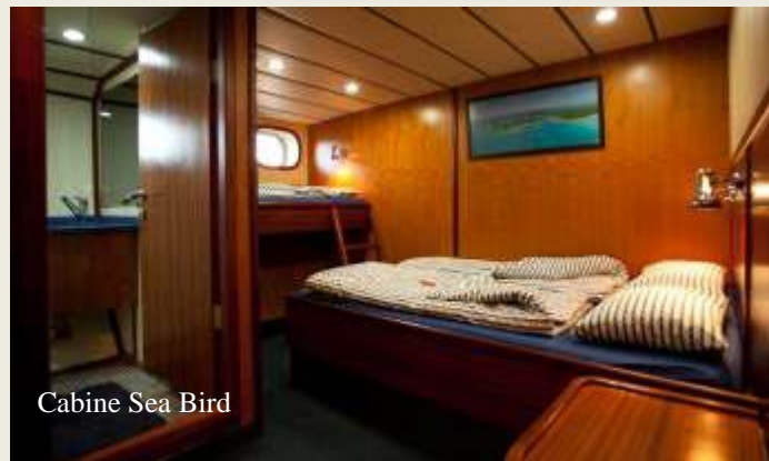
Cabine Sea Bird

Sea Star & Sea Bird accueillent chacun un équipage de 9 personnes pour assurer un rapport équipage-invité d'au moins 1 à 2, même en occupation maximale. L'équipage comprend un capitaine, un ingénieur, 2 matelots, 3 hôtesse, un moniteur de plongée et un chef dévoué.