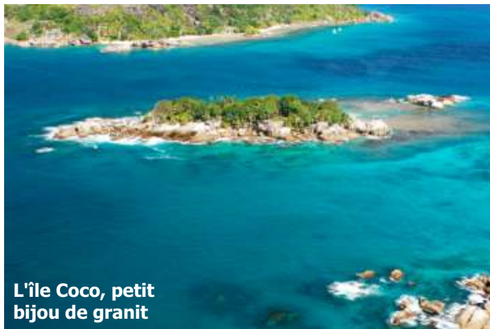
L'île Coco, petit bijou de granit

Dans la matinée le bateau naviguera vers Grande Soeur et Petite Soeur (les soeurs). Excellent site de plongée, palmes, masque, tuba et pour une visite à caractère unique de cette île tropicale inhabitée. Dans l'après-midi, visite de l'île Coco, petit bijou de granit, un endroit magnifique pour le snorkeling dans ce kaléidoscope de poissons tropicaux.