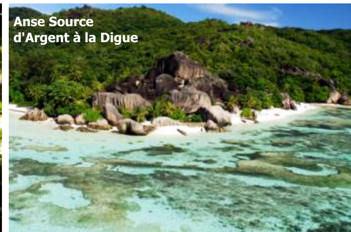
Anse Source d'Argent à la Digue

Navigation vers Praslin, deuxième île en terme de superficie pour une visite sur le site classé patrimoine mondial de l'humanité, la Vallée de Mai. Cette forêt ancienne est le foyer de la fameuse noix double, le coco de mer, ainsi que le perroquet noir des Seychelles unique à Praslin. Découvrez les sentiers de la vallée sous ce massif de palmiers endémiques avant de retourner à bord pour un après-midi plongée, P.M.T ou profiter d'autres sports nautiques.