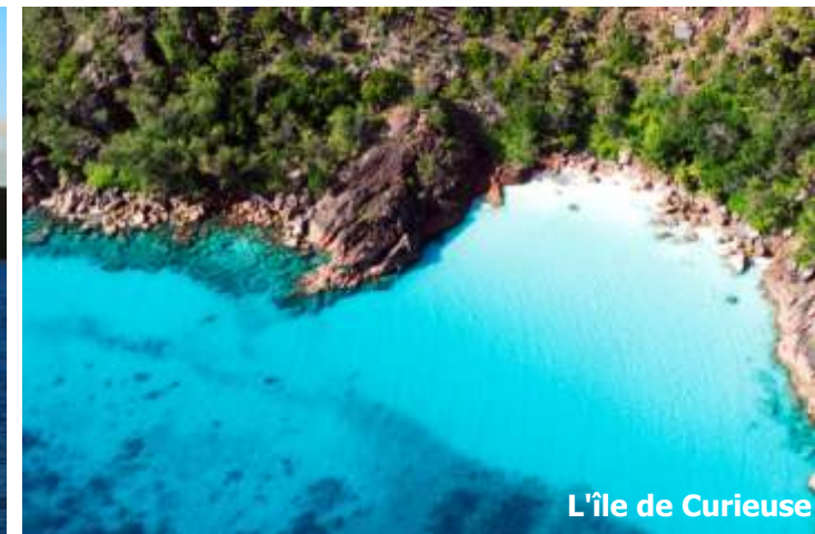
L'île de Curieuse

Dans la matinée, débarquez sur Curieuse pour une visite de cette île quasiment inhabitée. Vagabondez sur les sentiers de l'île dans la vaste forêt de mangroves, la ferme de tortues géantes et les ruines historiques de l'ancienne colonie de lépreux. Après un déjeuner barbecue sur l'île, profitez d'une variété de sports nautiques ou laissez-vous à la farniente sur une magnifique plage et eau turquoise.