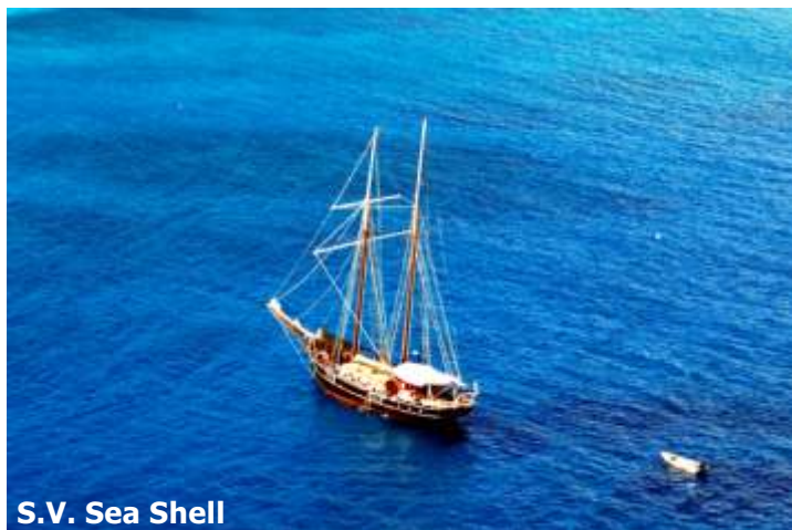
S.V. Sea Shell

Embarquement à l'Inter Island Quay à 1030hrs. Après l'accueil à bord suivi d'un commentaire du Capitaine, départ à 1200hrs vers l'île Ronde proche de Praslin. Arrivée, en fin d'après-midi pour un diner barbecue à bord.