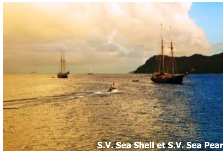
S.V. Sea Shell et S.V. Sea Pearl

Cap vers l'île Booby pour une matinée de plongée et d'activités nautiques. Après le déjeuner, navigation vers l'île Aride, l'une des plus belles réserves naturelles avec le plus d'espèces d'oiseaux marins que sur les autres îles qui s'y réfugient pour nicher. Cinq variété d'oiseaux endémiques et la plus grande population de trois espèces. Le sentier mène à une spectaculaire falaise, point de vue de la plus grande population de Frégates après l'île d'Aldabra. Aride est le seul endroit naturel de la planète où poussent les gardenias de Wright (le célèbre bois citron) et où 400 espèces de poissons ont été enregistrés autour de l'île.