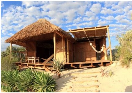
Bungalow Lalandaka Anakao

L'organisation se réserve le droit de modifier le parcours pour des raisons de nécessités ou d'imprévu