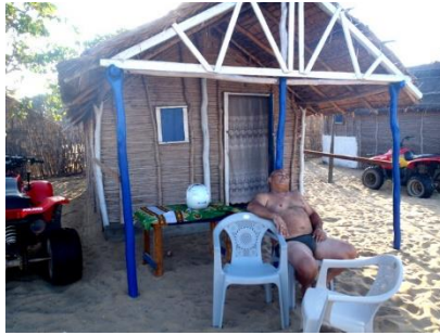
Auberge Saint Augustin