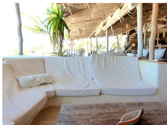
Restaurant bar Lalandaka Anakao